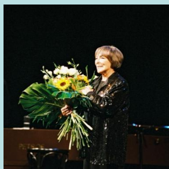
Benefiční koncert Hany Hegerové a Dana Bárty pro DD Radost

A hlavně se jim podařilo porazit byrokratickou saň, nenechaly se odradit hromadou formulářů, žádostí, povolení. Na vybudování a vybavení dětského domova získaly z evropských fondů neuvěřitelných 6.000.000,- Kč, 964.000,- Kč poskytl MHMP, a více než milion korun byl zajištěn od dárců a z benefičních akcí.