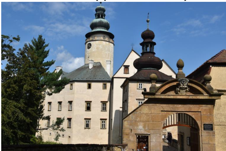
Zámek Lemberk (společná dovolená)