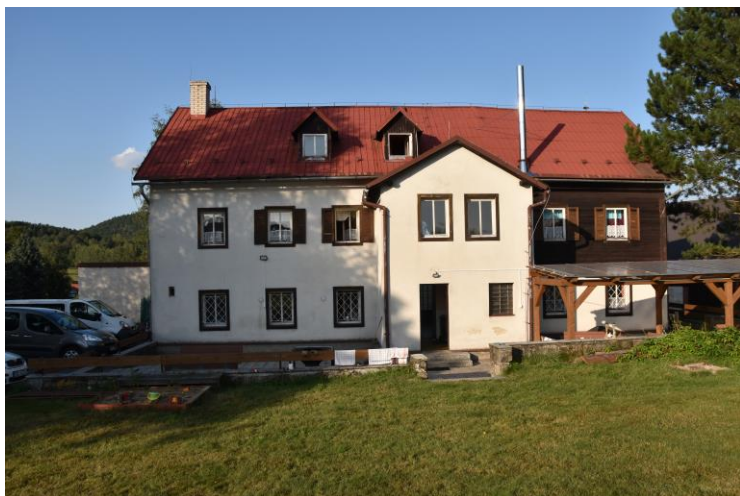
Chalupa Heřmanice v Podještědí (společná dovolená)