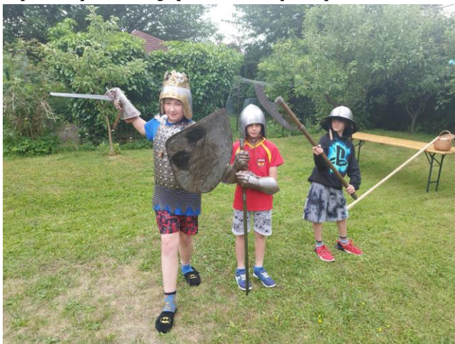
Rytířský souboj (zahradní párty – Den Radosti)